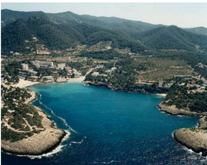
Cala Portinatx (Ibiza)

Durante todo el año Nauticspain organiza viajes en velero por las Baleares partiendo desde Denia (Alicante) o desde los diferentes puertos de las Islas Baleares.