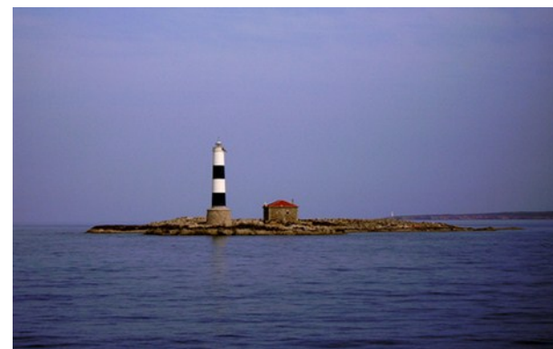
Faro en los Freus