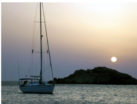
Cala d'Hort (Ibiza)

Navegaremos hasta Cala d'Hort (Es Vedrá) donde fondearemos: por la noche cena de despedida en un restaurante cercano.