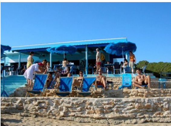
Blue Bar (Formentera)

Diferentes opciones de planes por Formentera: